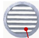
Aluminium gitter mit Netz