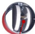
Brandchutzklappe 120 min./72°C